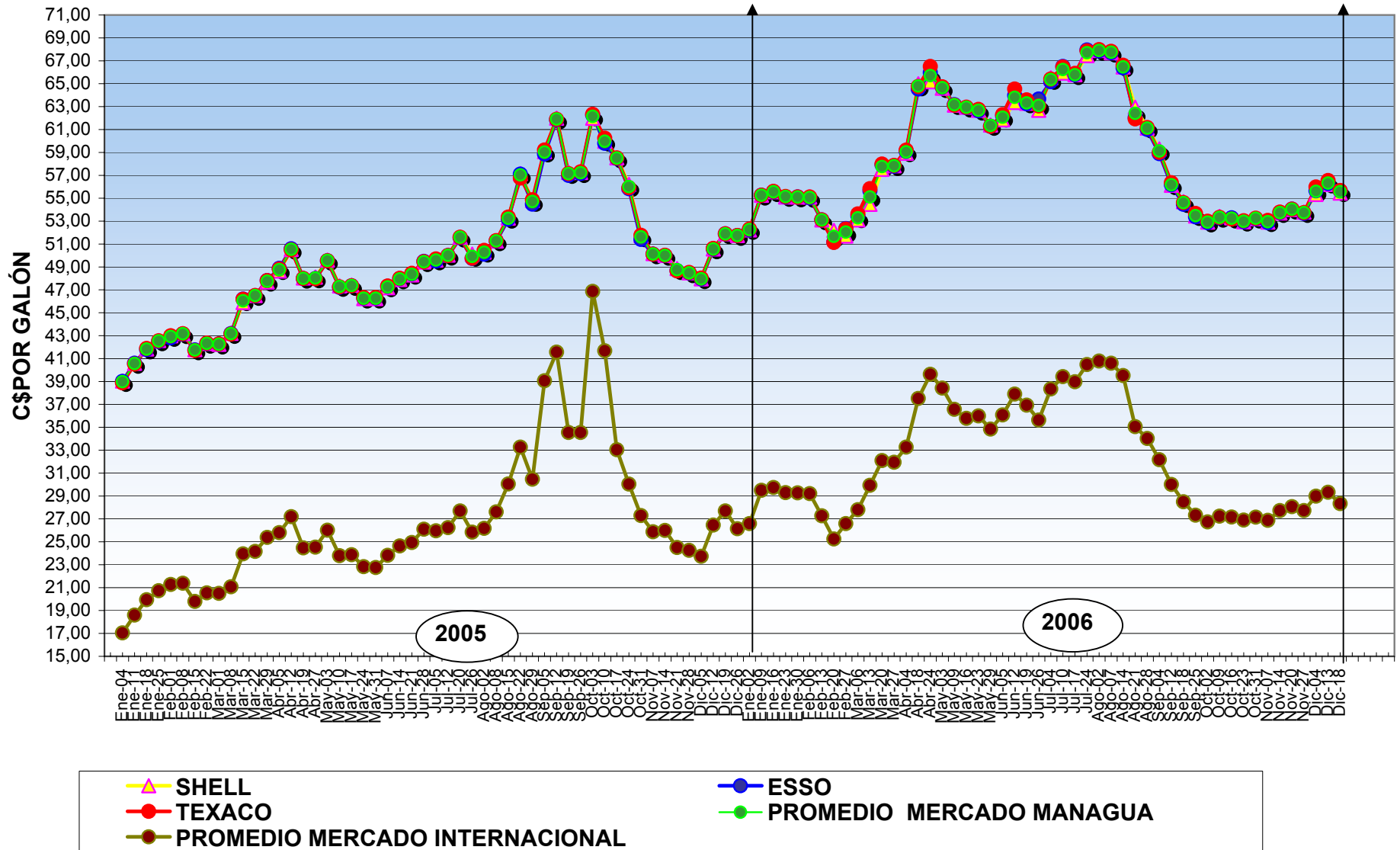
EVOLUCIÓN DE PRECIOS AL CONSUMIDOR DE LA GASOLINA REGULAR, EN MANAGUA Del 04 de Enero de 2005 al 18 de Diciembre de 2006